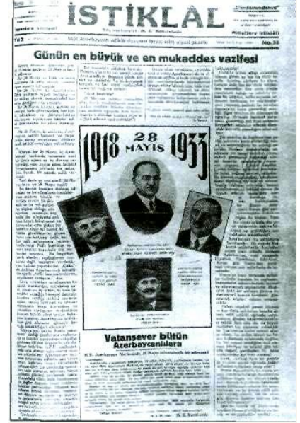
“İstiklal” qəzeti. 1932 Türkiyə

1946-cı ildə Bakıda Xarici Ölkələrlə Dostluq və Mədəni Əlaqələr Cəmiyyəti yaradılmışdır. Həmin vaxt Dövlət Təhlükəsizlik Komitəsinin xüsusi nəzarəti altında fəaliyyət göstərən qurumun əsas məqsədi xaricdə yaşayan azərbaycanlıların, xüsusilə də ziyalı təbəqəsinin Azərbaycanla əlaqəsinin qurulmasını təmin etməkdən ibarət idi. Ona görə də cəmiyyətin xaricdə yaşayan azərbaycanlılarla sıx əlaqələrin qurulması və Azərbaycan diasporunun formalaşmasında mühüm rol oynamışdır. Həmin illərdə Azərbaycan diasporunun formalaşmasında Azərbaycanın görkəmli ziyalılarının böyük fəaliyyətləri olmuşdur. Belə ki, Sovet rejimin ən sərt qaydalarının hökm sürdüyü vaxtlarda belə xaricdə yaşayan azərbaycanlılar öz Vətənləri ilə əlaqələrini davam etdirirdilər. Görülən işlərin ictimailəşdirilməsi üçün 1960-cı ildən cəmiyyətin nəzdində “Vətənin səsi” adlı qəzet nəşr edilirdi.