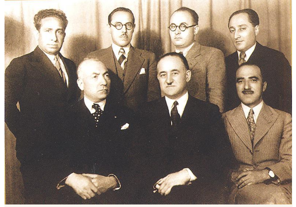
Azərbaycan mühacir təşkilatlarının təmsilçiləri Türkiyədə

“Vətən” Cəmiyyətinin xətti ilə xarici ölkələrə (Almaniya, Danimarka, Hollandiya, Türkiyə, İsveç, Norveç, Avstriya, Finlandiya, ABŞ və s.) ezam olunan onlarca tanınmış mədəniyyət, elm xadimi, incəsənət ustaları əslində, o zamanlar xaricdə heç bir nümayəndəliyi, səfirliyi olmayan ölkəmizi təmsil edir, Vətənimizin ədalətli mövqeyini müdafiə edir, həm həmvətənlər, həm xarici ölkə ictimaiyyəti arasında Azərbaycanın qədim, zəngin tarixini, milli-mənəvi dəyərlərini tanıdır, təbliğ edir, ölkəmizdə baş verən ictimai-siyasi hadisələr, Dağlıq Qarabağ problemi haqqında, erməni separatizmi və vəhşiliyi barədə obyektiv məlumatlar yayır, əsl həqiqətlər haqqında fikir formalaşdırırdılar.