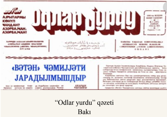
“Odlar yurdu” qəzeti Bakı

Həmin illər xaricdə fəaliyyət göstərən Azərbaycan cəmiyyətlərindən biri də Moskva şəhərində yaşayan ziyalılar, elm və mədəniyyət xadimlərinin təşəbbüsü ilə 1988-ci ildə əsası qoyulmuş “Ocaq” Mədəniyyət Mərkəzi idi. Cəmiyyətin “Çıraq” adlı mətbu orqanı nəşr edilirdi.