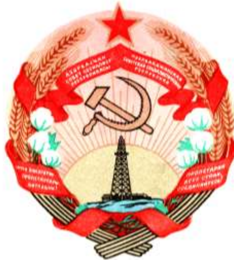
ЦВЕТНОЕ И ЧЕРНО-БЕЛОЕ ИЗОБРАЖЕНИЯ ГОСУДАРСТВЕННОГО ГЕРБА АЗЕРБАЙДЖАНСКОЙ СОВЕТСКОЙ СОЦИАЛИСТИЧЕСКОЙ РЕСПУБЛИКИ