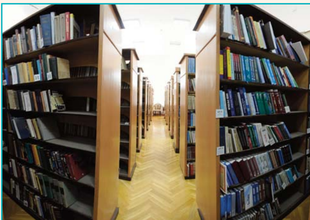
Книжный фонд Президентской библиотеки Управления делами Президента Азербайджанской Республики

Пятая глава называется «Электронные ресурсы». Здесь пользователям представлена электронная версия двадцати книг по экологии из фонда библиотеки.