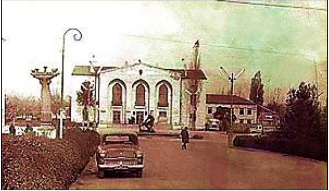
Ağdam Dram Teatrı işğaldan əvvəl