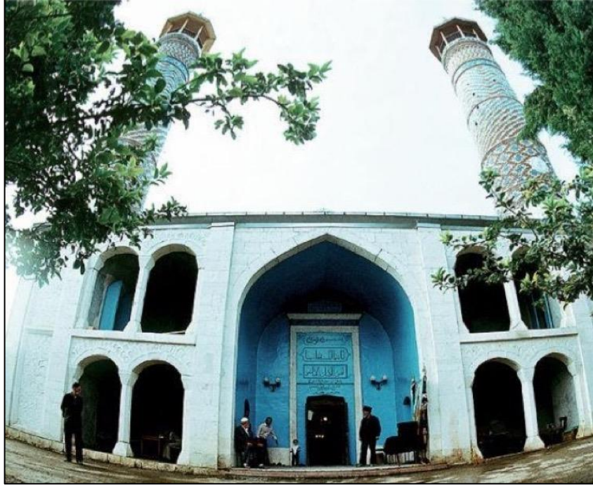
Ağdam Cümə Məscidi işğaldan əvvəl