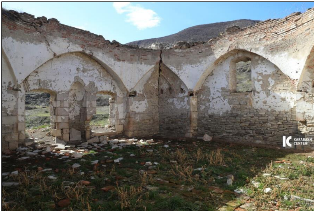
Erməni vandallarının viran qoyduğu Güləbli kəndində məscid