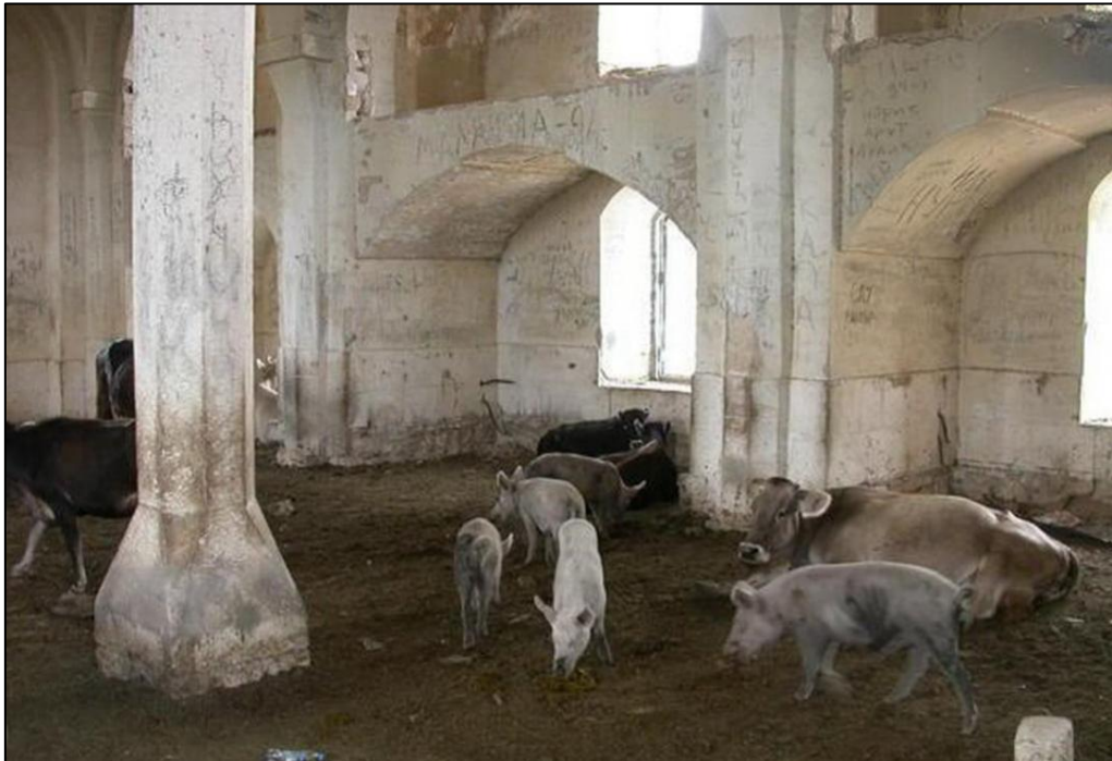
Ermənilərin tövləyə çevirdikləri Ağdam Cümə məscidi.