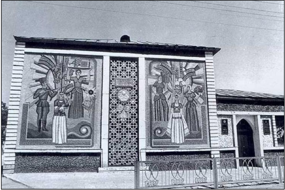
Ağdam Çörək Muzeyi işğaldan əvvəl