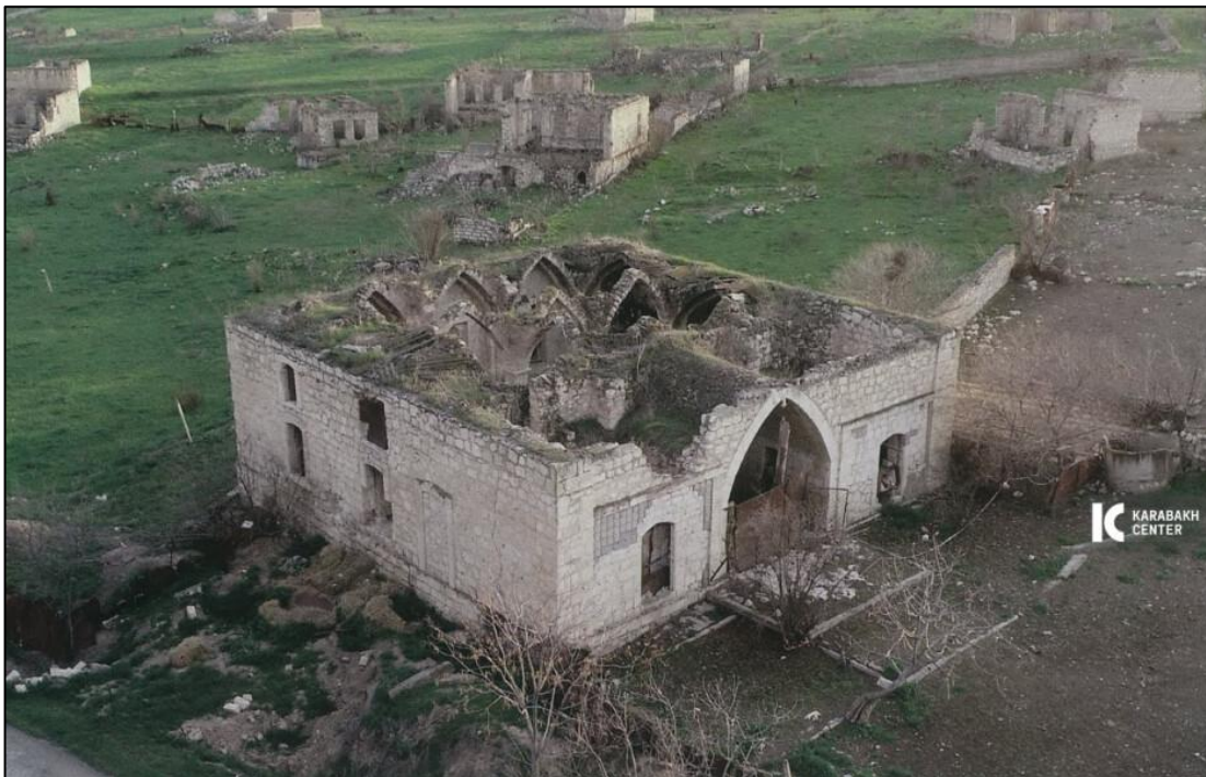
Erməni vandallarının viran qoyduğu Qiyaslı kəndində məscid