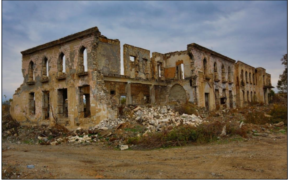
Erməni vandalları tərəfindən dağıdılmış memarlıq tikilisi