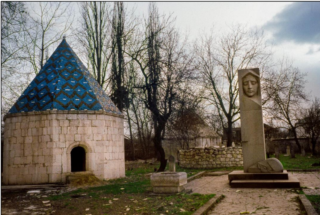
Xan qızı Natəvanın bərpa edilmiş qəbirüstü abidəsi.