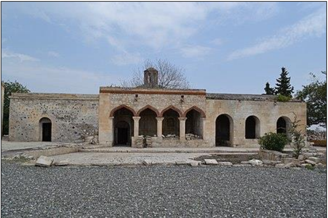
Pənahəli xanın imarəti erməni işğalından azad edildikdən sonra