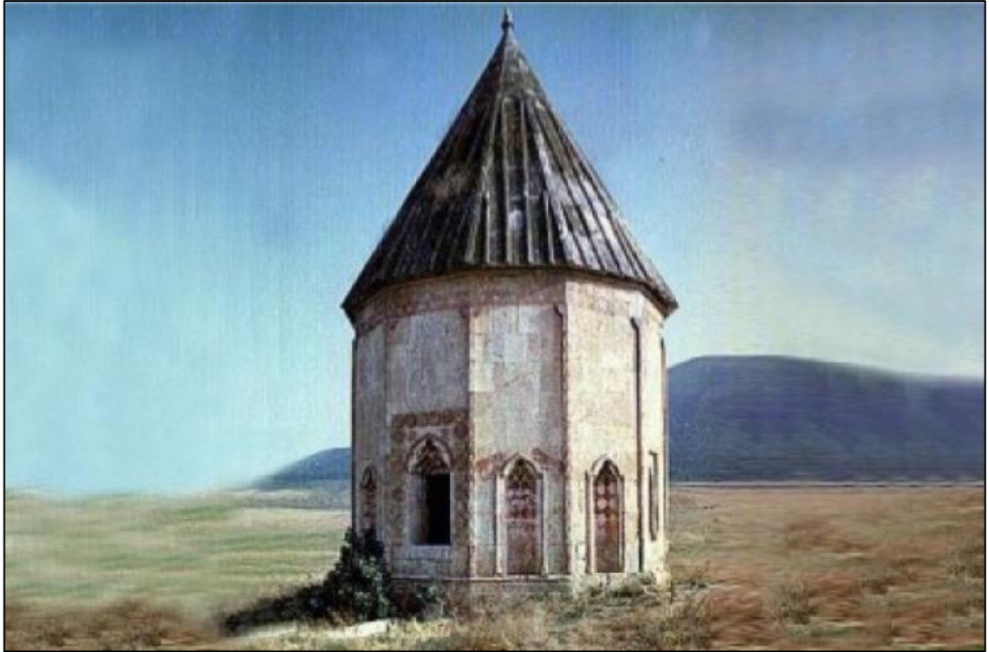
Xaçın Türbətli kəndində Qutlu Musa türbəsi