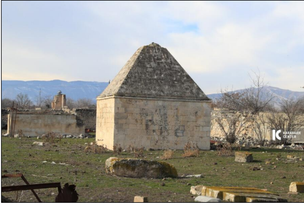
Ağdam şəhərində Mehdiqulu xanın türbəsi