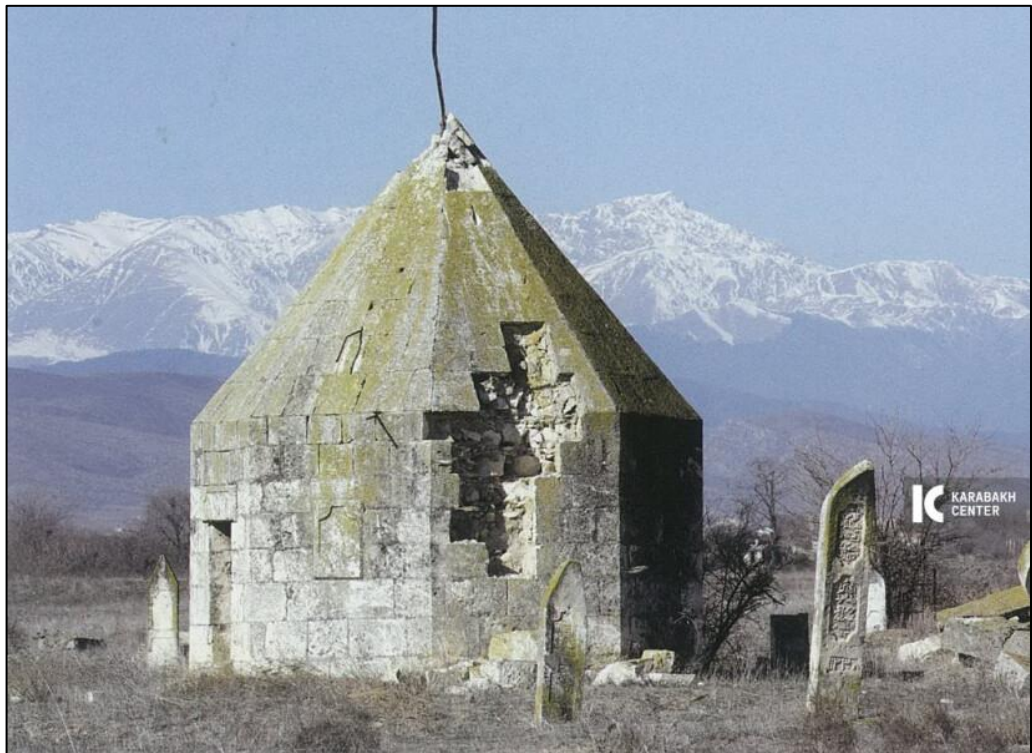
Kosalar kəndində türbə