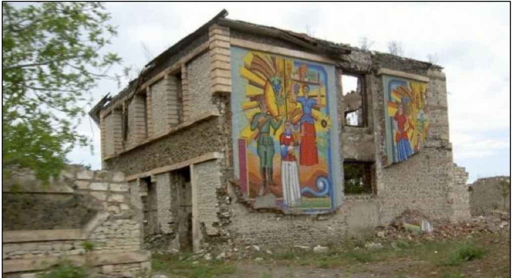
Erməni vandallarının dağıtdığı Ağdam Çörək Muzeyi