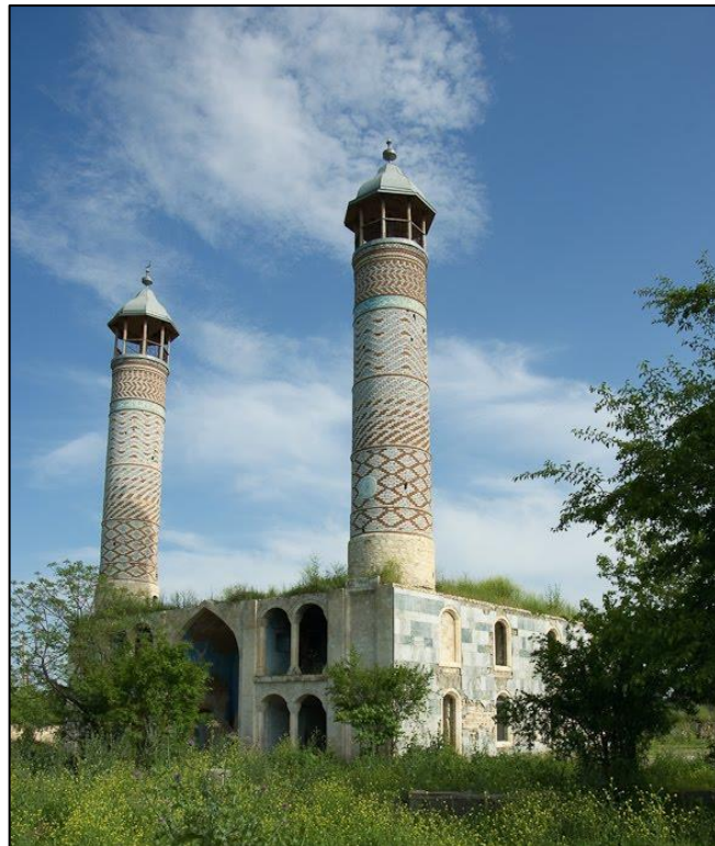
Ağdam Cümə Məscidi işğal dövründə