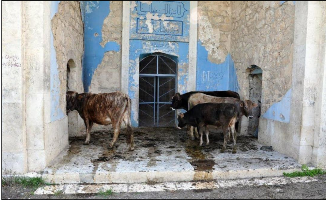
Ermənilərin tövləyə çevirdikləri Ağdam Cümə məscidi.