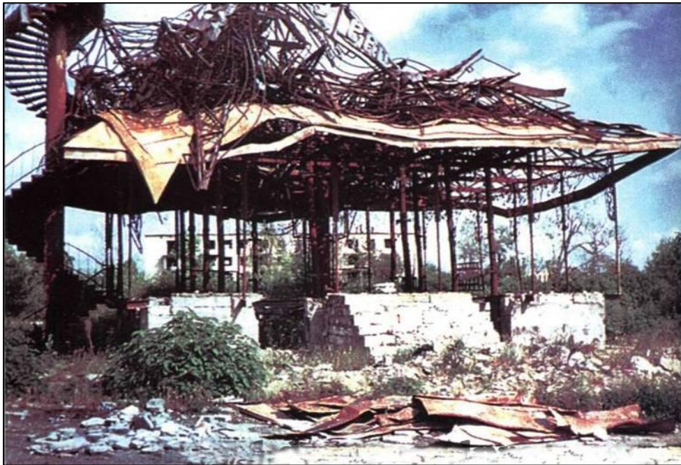
Erməni vandallarının yandırdığı Çay evi