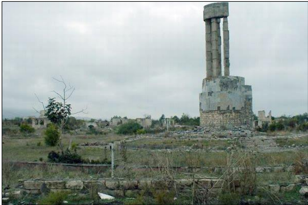
Erməni vandalları tərəfindən dağıdılmış memarlıq abidəsi