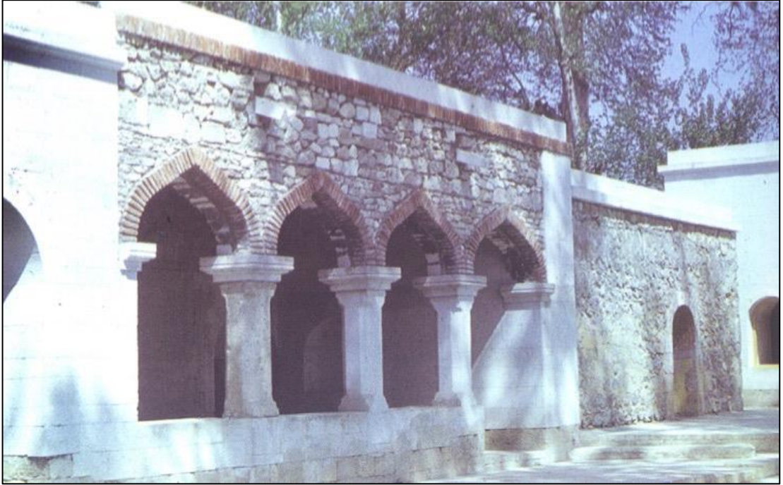
XVIII əsrə aid Qiyaslı kəndində Pənahəli xanın imarəti işğaldan əvvəl