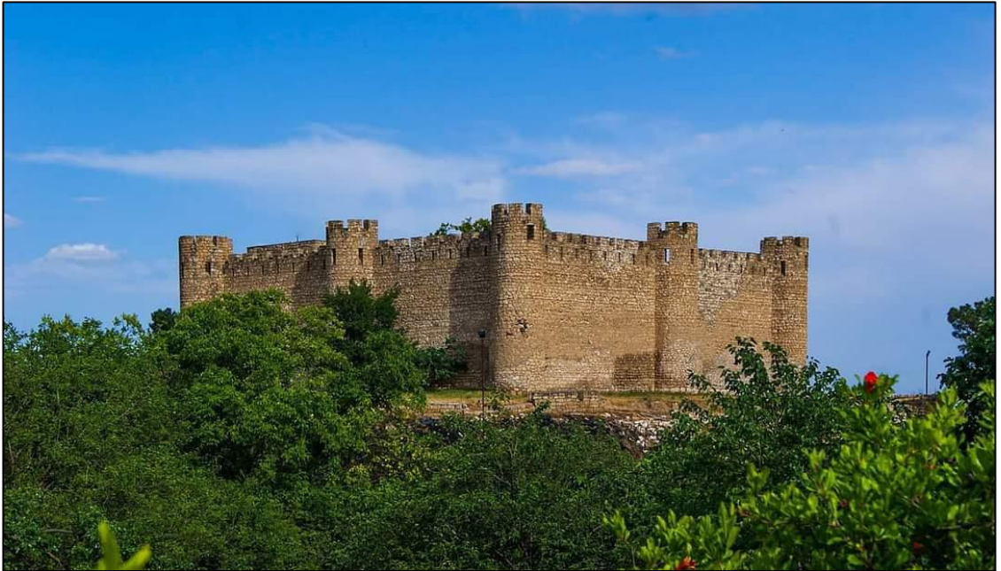
Pənahəli xan tərəfindən inşa edilmiş Şahbulaq sarayı