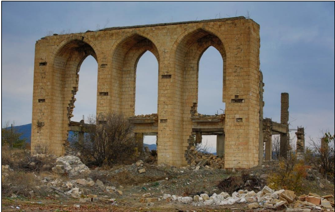
Erməni vandalları tərəfindən dağıdılmış Ağdam Dram Teatrı