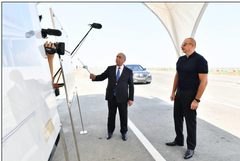
Bərdə-Ağdam avtomobil yolunda görülən işlərlə tanışlıq. 04.10.2022