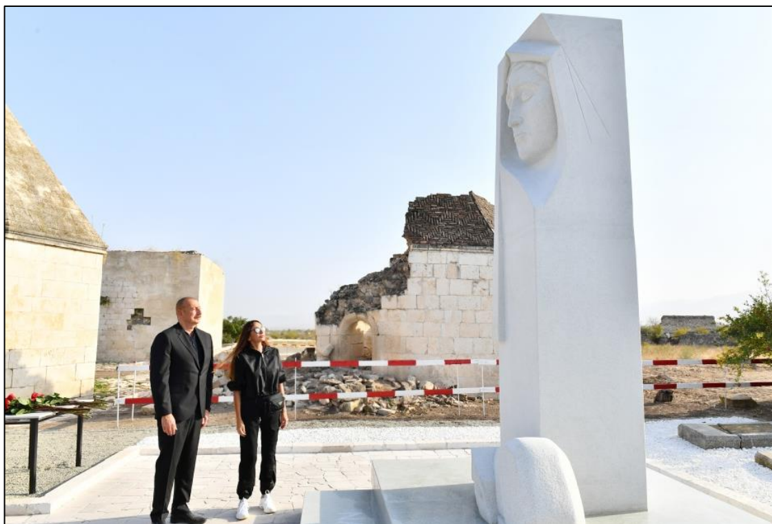
Xurşidbanu Natəvanın qəbirüstü abidəsinin açılışı. 04.10.2022