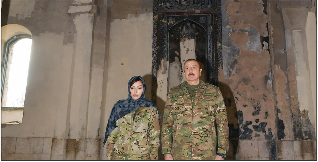
İşğaldan azad edilmiş Ağdam şəhər məscidində. 23.11.2020