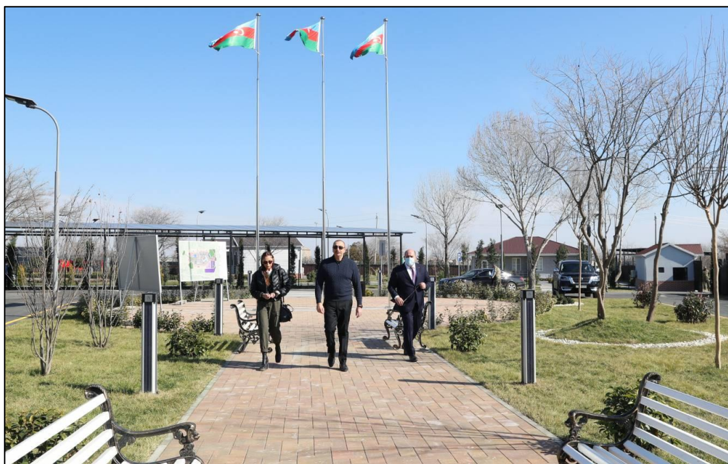
Azərbaycan Respublikası Prezidentinin xüsusi nümayəndəliyinin qərarında yaradılan şəraitlə tanışlıq. 14.02.2022