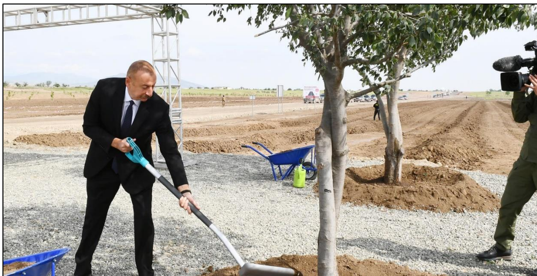
Ağdam şəhər meşə-parkında ağac əkilməsi mərasimi. 28.05.2021