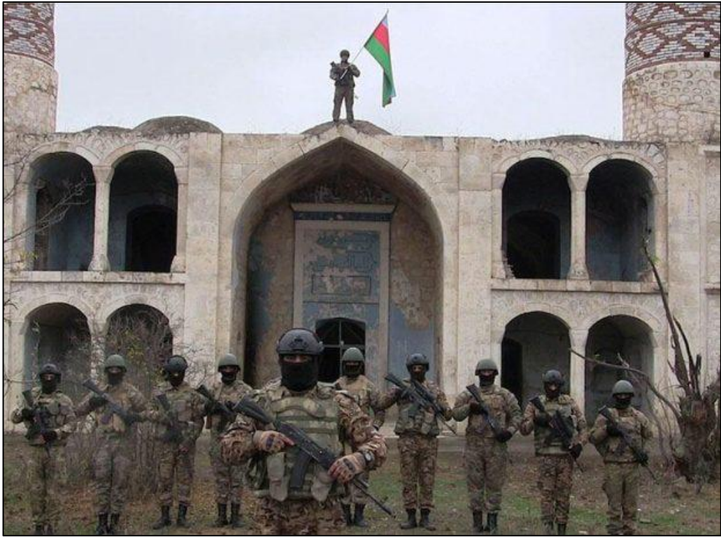
Azad Ağdam şəhəri