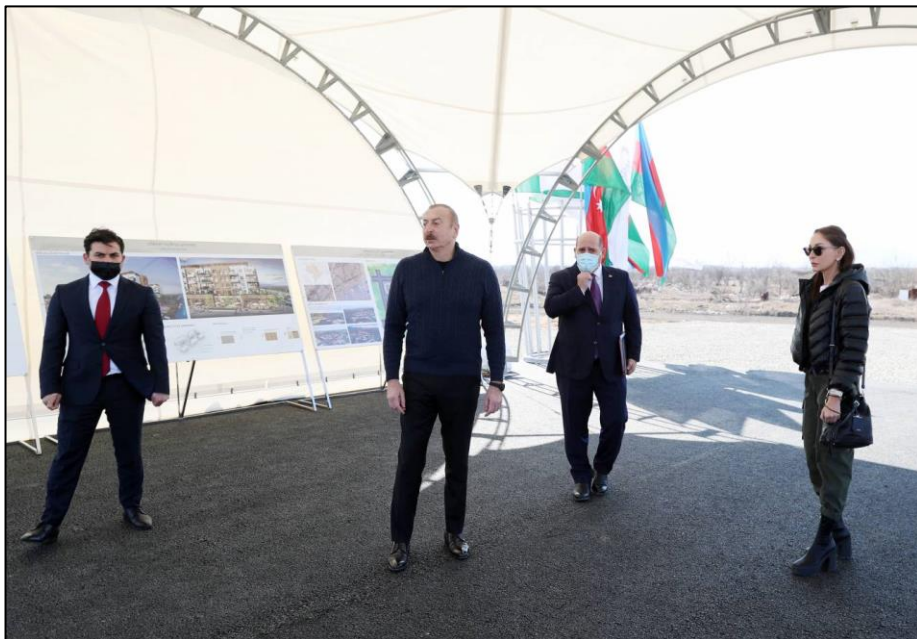
Yeni yaşayış kompleksinin təməlinin qoyulması mərasimi. 14.02.2022