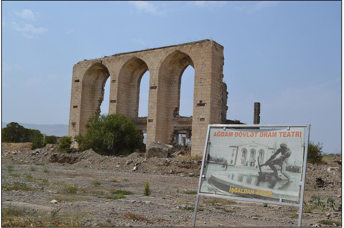
Ağdam Dövlət Dram Teatrı işğaldan sonra