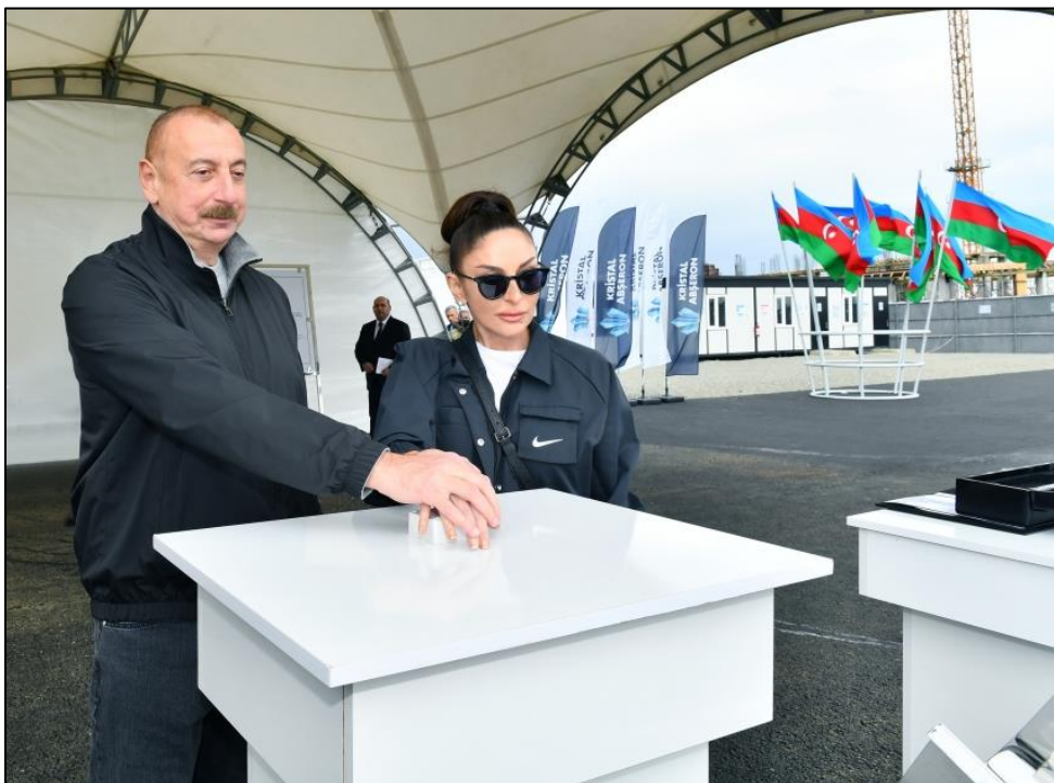
Ağdam Muğam Mərkəzinin təməlinin qoyulması mərasimi. 02.05.2023