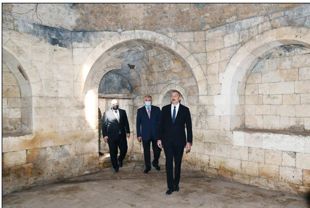
Qarabağ xanlığının banisi Pənahəli xanın sarayının yerləşdiyi imarət kompleksinə baxış. 28.05.2021