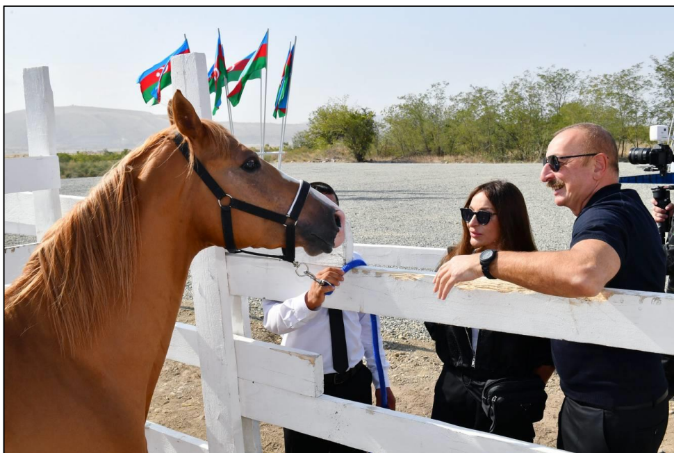
Atılıq Nəsilartırma Mərkəzinin təməlinin qoyulması. 04.10.2022