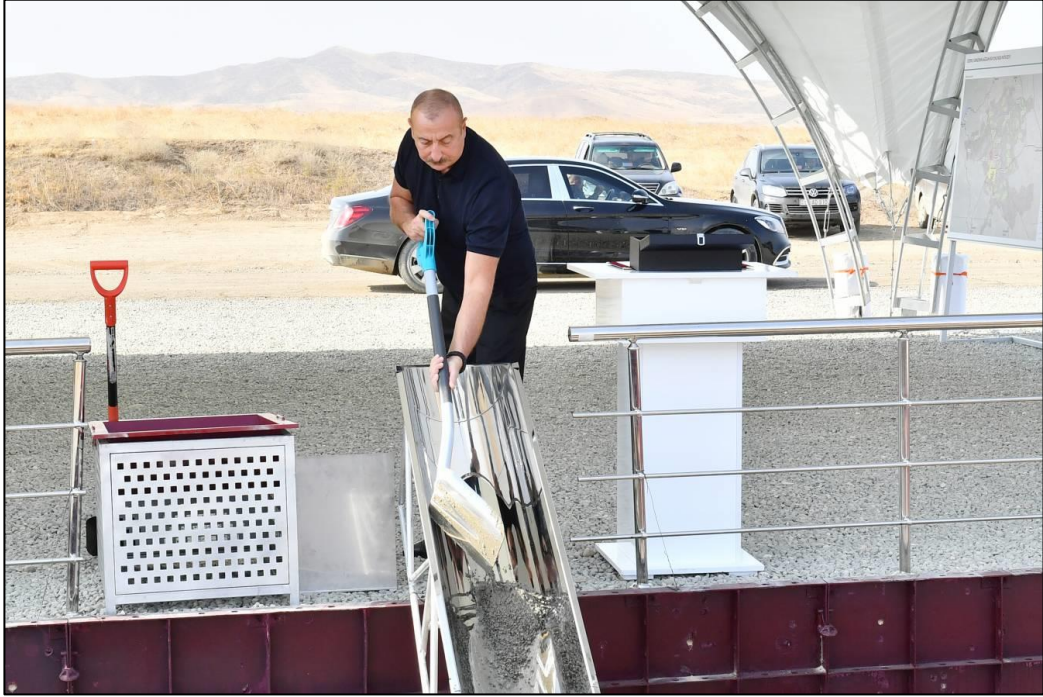
Xıdırlı kəndinin təməlqoyma mərasimi. 04.10.2022