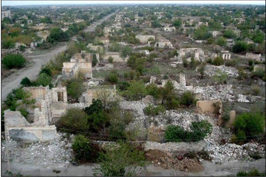
Erməni vandalları tərəfindən viran qoyulmuş Ağdam şəhəri