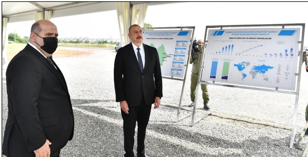
Ağdam Sənaye Parkının təməlqoyma mərasimi. 28.05.2021