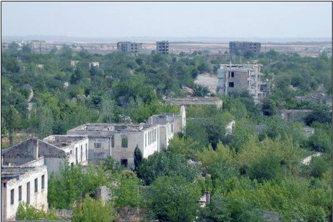
Erməni vandalları tərəfindən viran qoyulmuş Ağdam şəhəri