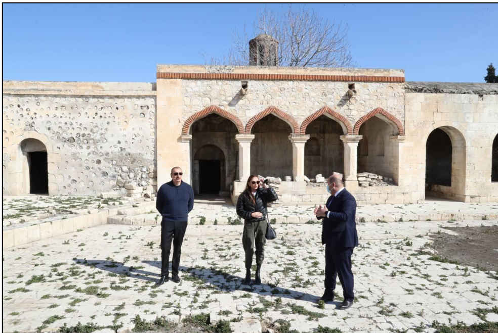
Qarabağ xanlarının türbələri və yaşayış evi - İmarət kompleksində aparılan işlərlə tanışlıq. 14.02.2022