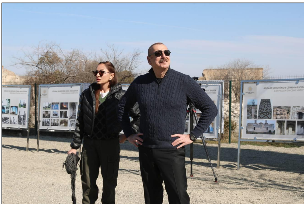
Ağdam Cümə məscidində bərpa işlərinin gedişi ilə tanışlıq. 14.02.2022