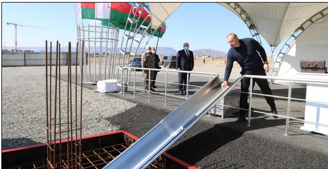
“Park Forest Otel Ağdam” mehmanxanasının təməlinin qoyulması mərasimi. 14.02.2022