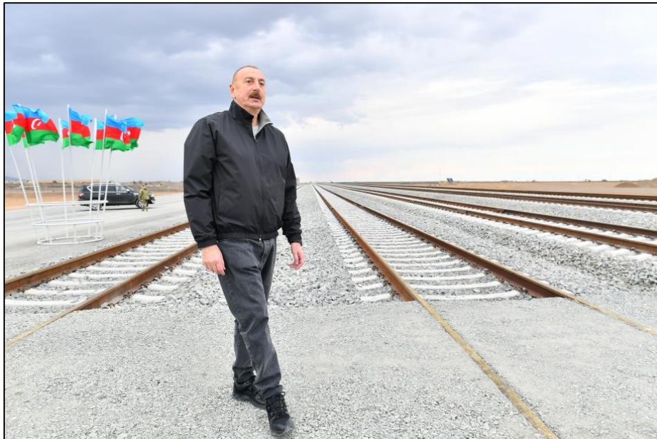
Bərdə-Ağdam dəmir yolu xəttinin tikintisi ilə tanışlıq. 02.05.2023