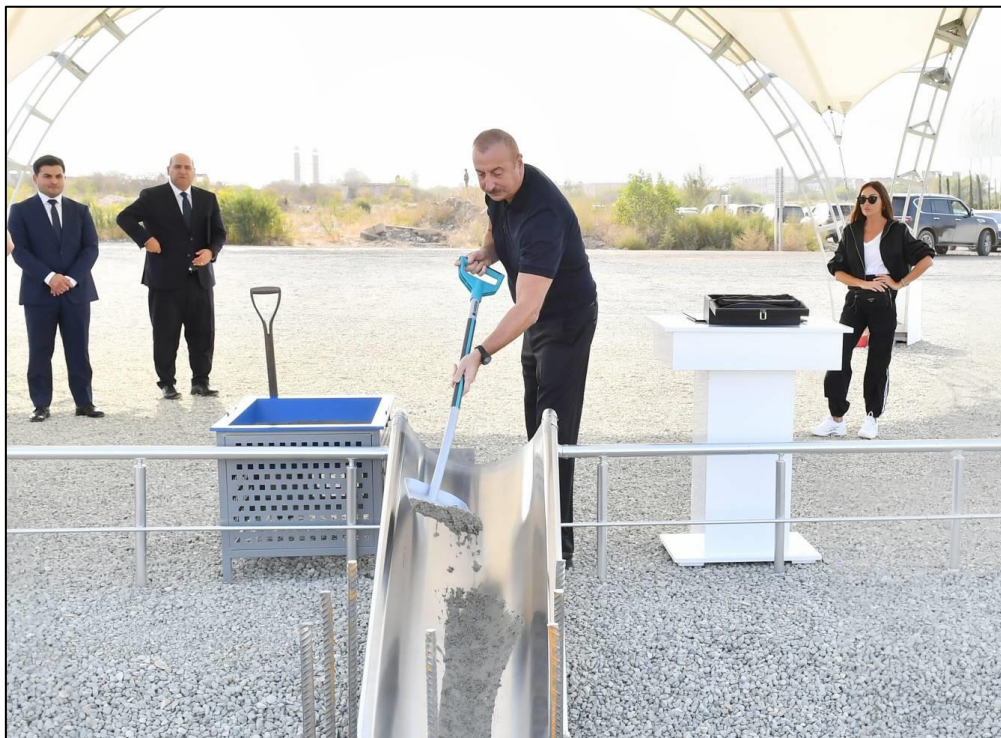
Ağdam şəhərində "City Hotel Agdam" mehmanxanasının təməlinin qoyulması. 04.10.2022