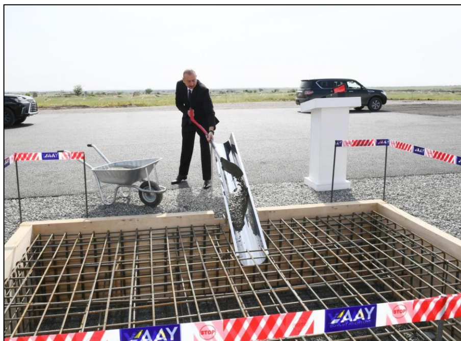
Bərdə-Ağdam avtomobil yolunun təməlqoyma mərasimi. 28.05.2021