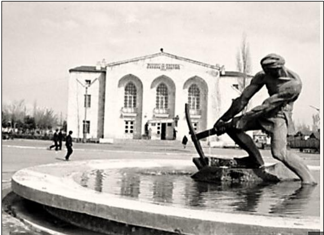
Ağdam Dövlət Dram Teatrı işğaldan əvvəl