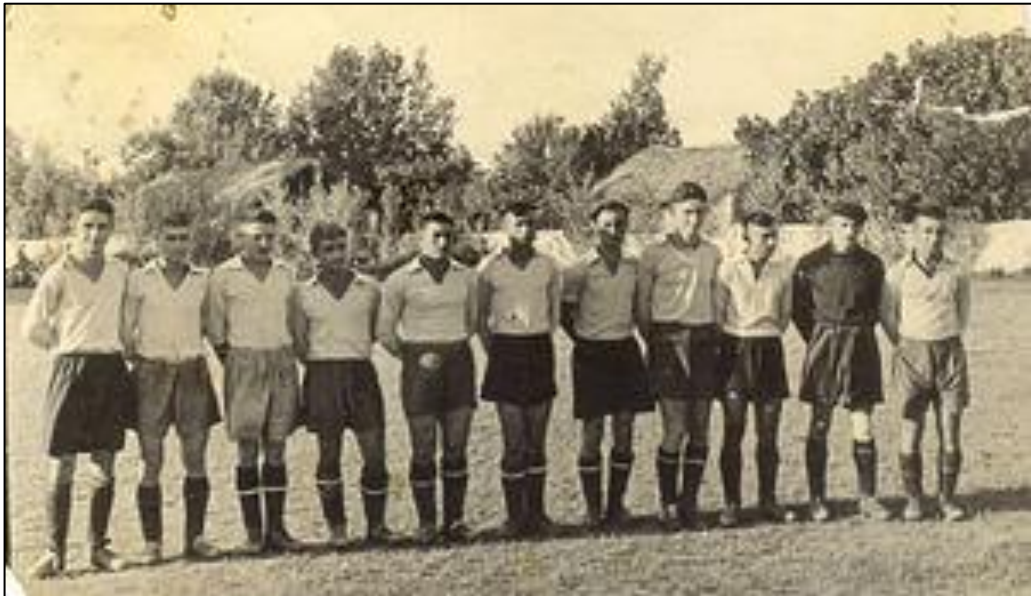
Ağdam futbol komandası. 1953-cü il