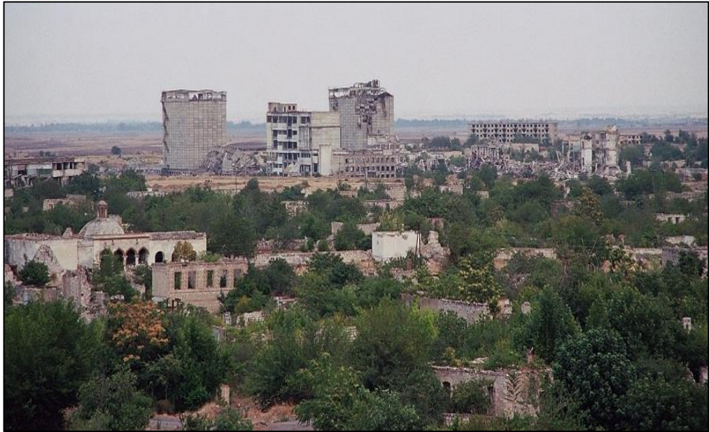
Erməni vandalları tərəfindən viran qoyulmuş Ağdam şəhəri