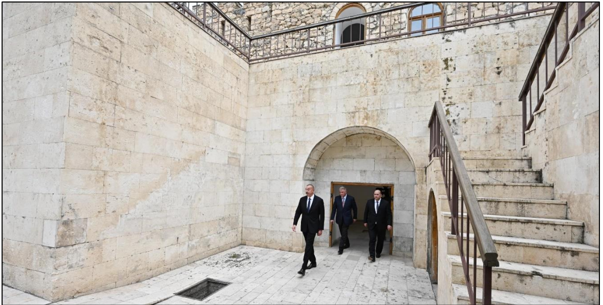
Şahbulaq qalası. 28.05.2021