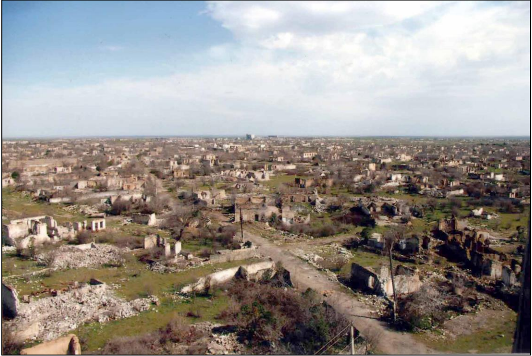
Erməni vandalları tərəfindən viran qoyulmuş Ağdam şəhəri