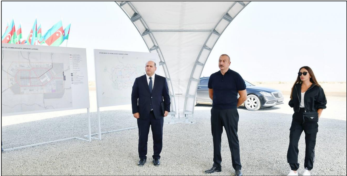
Ağdam şəhərinin daxili yol və kommunikasiya şəbəkəsinin təməlinin qoyulması. 04.10.2022