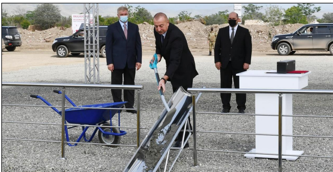
Ağdam şəhərində inşa olunacaq ilk yaşayış binasının təməlqoyma mərasimi. 28.05.2021