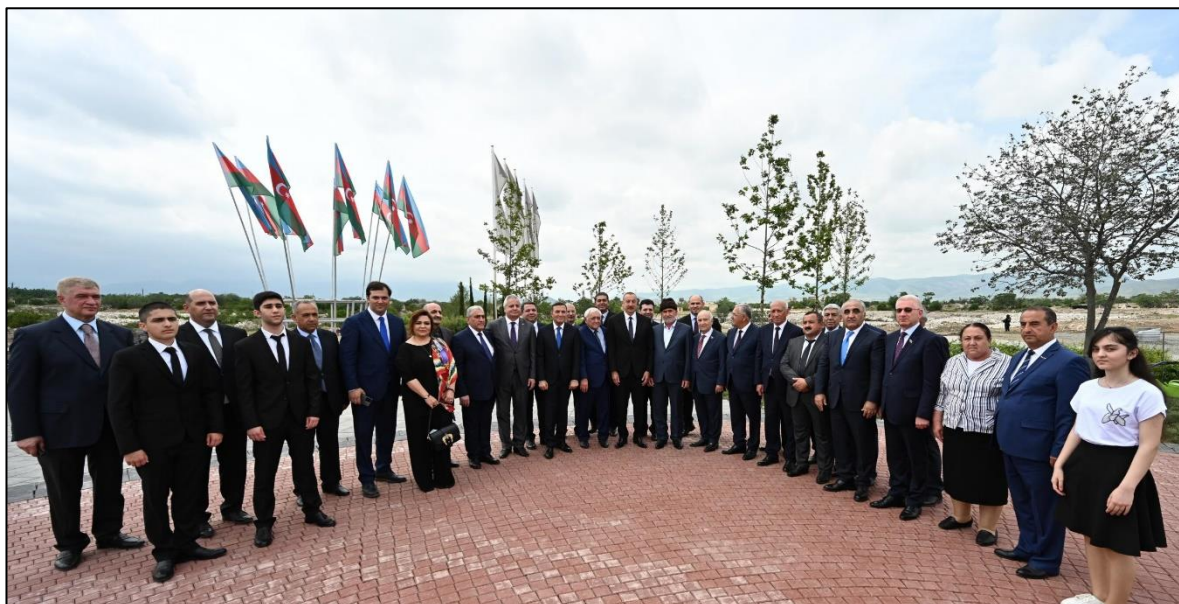
Rayon ictimaiyyətinin nümayəndələri ilə görüş. 28.05.2021