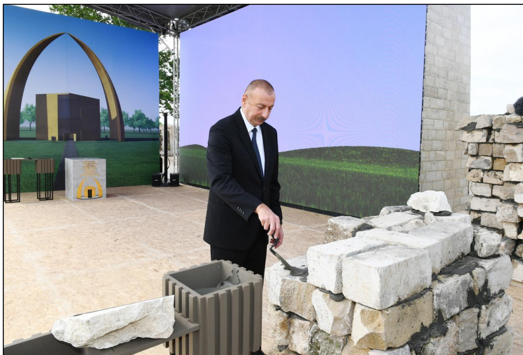
Zafər muzeyi və açıq hava altında İşğal muzeyinin təməlqoyma mərasimi. 28.05.2021