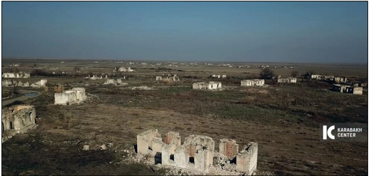
Eyvazxanbəyli kəndi işğaldan sonra