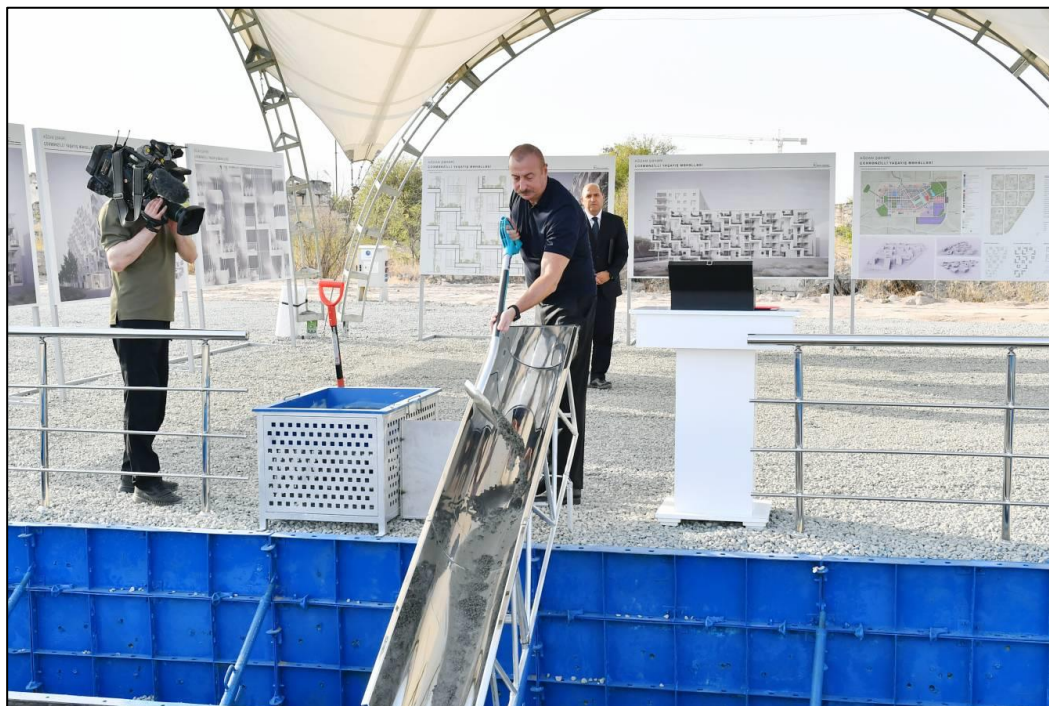
Məcburi köçkünlər üçün Ağdam şəhərində inşa olunacaq yaşayış məhəlləsinin təməlinin qoyulması. 04.10.2022