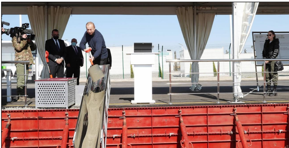
Ağdam Sənaye Parkında iki müəssisənin təməlinin qoyulması. 14.02.2022