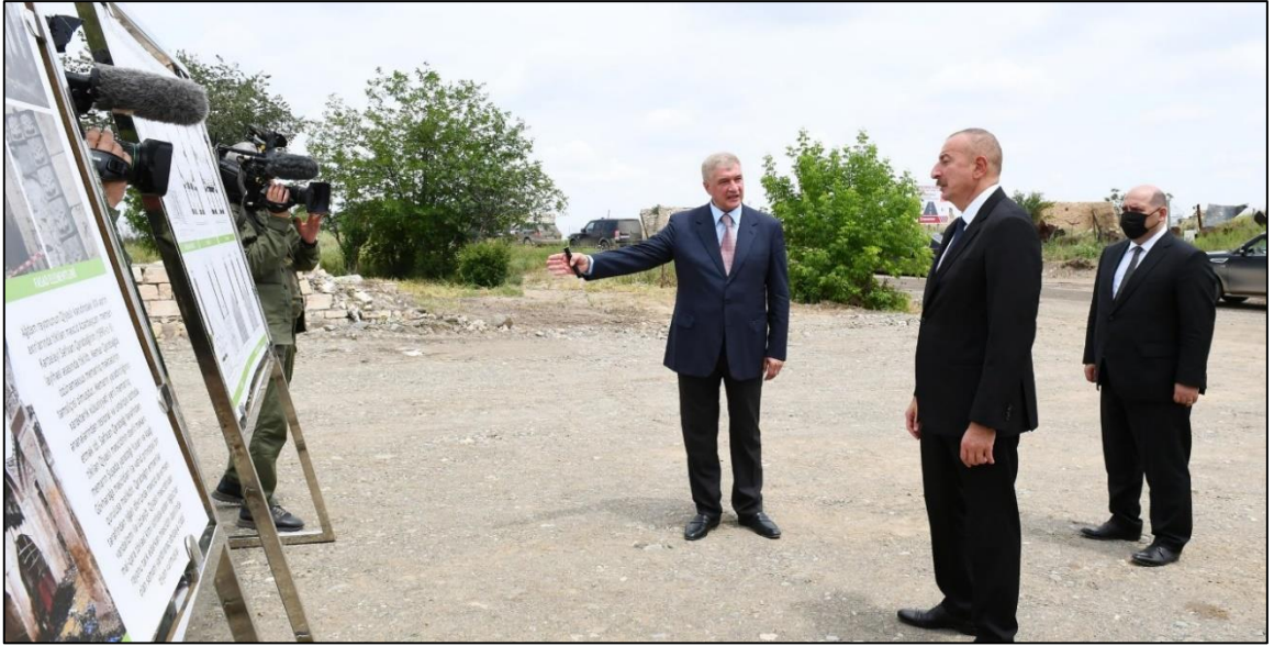
Qiyaslı məscidi. 28.05.2021