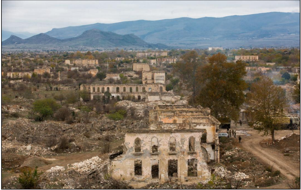
Erməni vandalları tərəfindən viran qoyulmuş Ağdam şəhəri