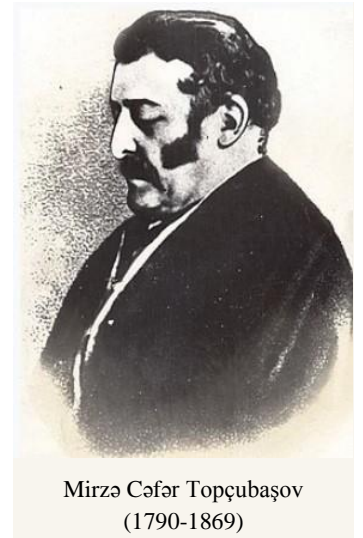
Mirzə Cəfər Topçubaşov (1790-1869)

və Azərbaycan diasporunun tarixinə öz adlarını qızıl hərflərlə həkk etmişlər. Baba Kuhi Bakuvı, Xətib Təbrizi, Səfiəddin Urməvi, Əbdürrəşid Əl-Bakuvı, Hacı Zeynalabdin Şirvani, Cəlaləddin Əfqani, Mirzə Cəfər Topçubaşov, Mirzə Kazım bəy, Əlimərdan bəy Topçubaşov, Əli bəy Hüseynzadə, Xəlil bəy Xasməmmədov, Nağı bəy Şeyxzamanlı, Məmməd Əmin Rəsulzadə, Cahangir Kazımbəyli, Mirzə Bala Məmmədzadə, Hüseyn Baykara, Ceyhun bəy Hacıbəyli, Şəfi bəy Rüstəmbəyov, Məmməd Sadıq Aran, Əhməd bəy