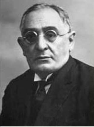
Əhməd bəy Ağaoğlu (1869-1939)

Mühacirət edənlərin içərisində Azərbaycan Xalq Cümhuriyyətinin dövlət, ictimai-siyasi xadimləri, Müsavat və digər partiyaların üzvləri, iri sahibkarlar, onların övladları var idi. Azərbaycan milli hərəkatının görkəmli nümayəndələri dünyanın müxtəlif dövlətlərində Azərbaycan siyasi mühacirətinin əsasını qoyaraq milli istiqlal və dövlətçilik düşüncəsinin gələcək nəsillərə ötürülməsində və milli mentalitetimizin yaşadılmasında müstəsna xidmət göstərmişlər.