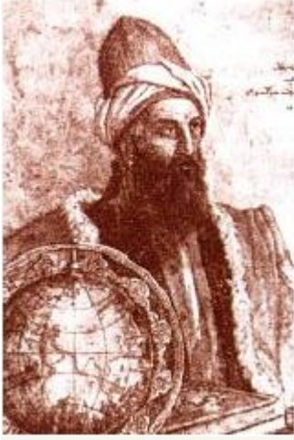
Hacı Zeynalabdin Şirvani (1780-1838)

verir. İpək yolu vasitəsilə zaman-zaman ticarət və səyahət məqsədilə dünyanın fərqli bölgələrinə səpələnən azərbaycanlılar diasporumuzun ilk şaxələri hesab oluna bilər.