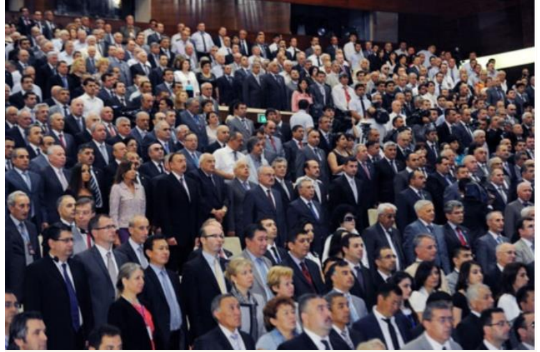
Dünya Azərbaycanlılarının III Qurultayı 2011

2011-ci il iyulun 5-6-da Dünya Azərbaycanlılarının III qurultayının keçirilməsi diaspor quruculuğu işinə yeni təkan vermişdir. Qurultayda 42 ölkədən seçilmiş 600 nümayəndədən 579 nəfəri, habelə dünyanın 30 ölkəsindən 211 nəfər qonaq qismində iştirak etmişdir. Qurultaya ümumilikdə 13 ölkənin parlamentindən 37 deputat qatılmışdır.