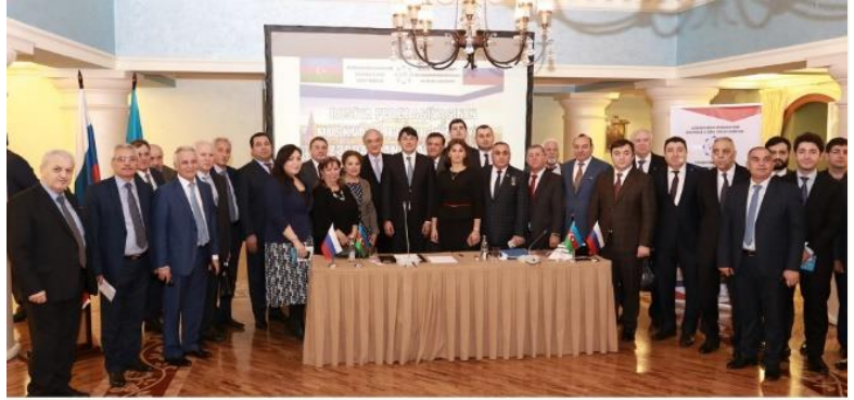
Azərbaycan diasporu fəalları bir arada. Moskva 2019

Hazırda Azərbaycan diaspor quruculuğunun qarşısında dayanan əsas təşkilati problemlər aşağıdakılardır: 1) azərbaycanlıların məskunlaşdıqları bütün xarici ölkələrdə, şəhərlərdə onların