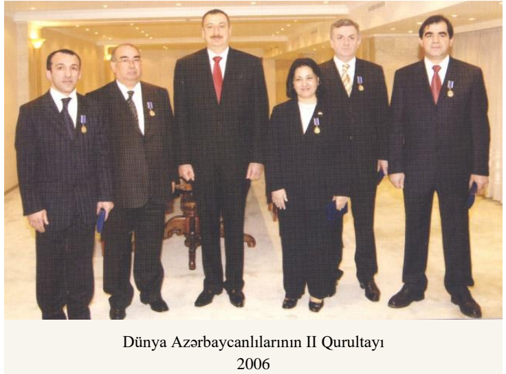
Dünya Azərbaycanlılarının II Qurultayı 2006

2006-cı il martın 16-da Azərbaycan Respublikası Prezidentinin sərəncamı ilə Bakı şəhərində Dünya Azərbaycanlılarının II Qurultayı keçirilmişdir. Dünya Azərbaycanlılarının II Qurultayı tarixi məzmununa və ictimai əhəmiyyətinə görə, ilk qurultaydan bir çox cəhətləri ilə seçilirdi. Bu fərqlərdən başlıcası Azərbaycanın müstəqil dövlət olaraq keçdiyi inkişaf yolu ilə bağlı idi. Qurultayda 49 xarici ölkədən 593 nümayəndə və 388 nəfər qonaq iştirak etmişdir. Dünya Azərbaycanlılarının II Qurultayında Azərbaycan Respublikasının Prezidenti İlham Əliyevin nitq söyləmişdir.