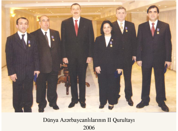
Dünya Azərbaycanlılarının II Qurultayı 2006

2006-cı il martın 16-da Azərbaycan Respublikası Prezidentinin sərəncamı ilə Bakı şəhərində Dünya Azərbaycanlılarının II Qurultayı keçirilmişdir. Dünya Azərbaycanlılarının II Qurultayı tarixi məzmununa və ictimai əhəmiyyətinə görə, ilk qurultaydan bir çox cəhətləri ilə seçilirdi. Bu fərqlərdən başlıcası Azərbaycanın müstəqil dövlət olaraq keçdiyi inkişaf yolu ilə bağlı idi. Qurultayda 49 xarici ölkədən 593 nümayəndə və 388 nəfər qonaq iştirak etmişdir. Dünya Azərbaycanlılarının II Qurultayında Azərbaycan Respublikasının Prezidenti İlham Əliyevin nitq söyləmişdir.