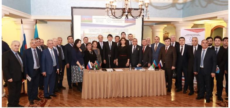
Azərbaycan diasporu fəalları bir arada. Moskva 2019

Hazırda Azərbaycan diaspor quruculuğunun qarşısında dayanan əsas təşkilati problemlər aşağıdakılardır: 1) azərbaycanlıların məskunlaşdıqları bütün xarici ölkələrdə, şəhərlərdə onların