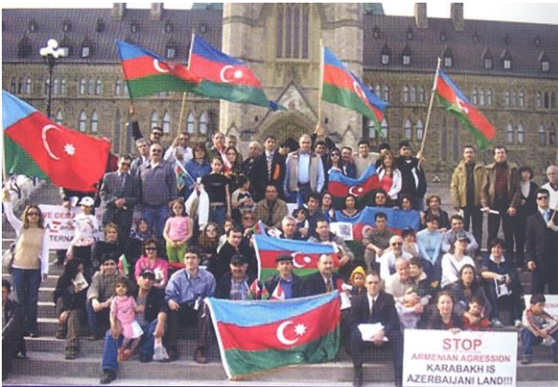
Kanadada Azərbaycan və türk icmalarının birgə mitinqi 2006

2007-ci il noyabrın 17-19-da Bakıda Türk Dövlət və Cəmiyyətlərinin XI Dostluq, Qardaşlıq və Əməkdaşlıq Qurultayı keçirilmişdir. 30 ölkədən 550 nəfər nümayəndə və qonağın dəvət olduğu qurultayın işində Azərbaycan Respublikasının, Türkiyə Cümhuriyyətinin, Şimali Kipr Respublikasının prezidentləri, habelə türkdilli dövlətlərin yüksək dövlət və hökumət nümayəndələri iştirak etmişlər.