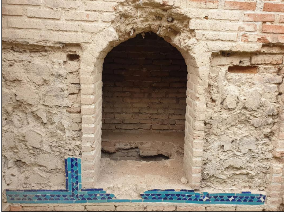
Babı kəndinin ərazisində qədim şəhərin qalıqları