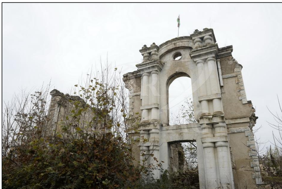
Füzuli şəhərində erməni vandalları tərəfindən dağıdılmış memarlıq binası