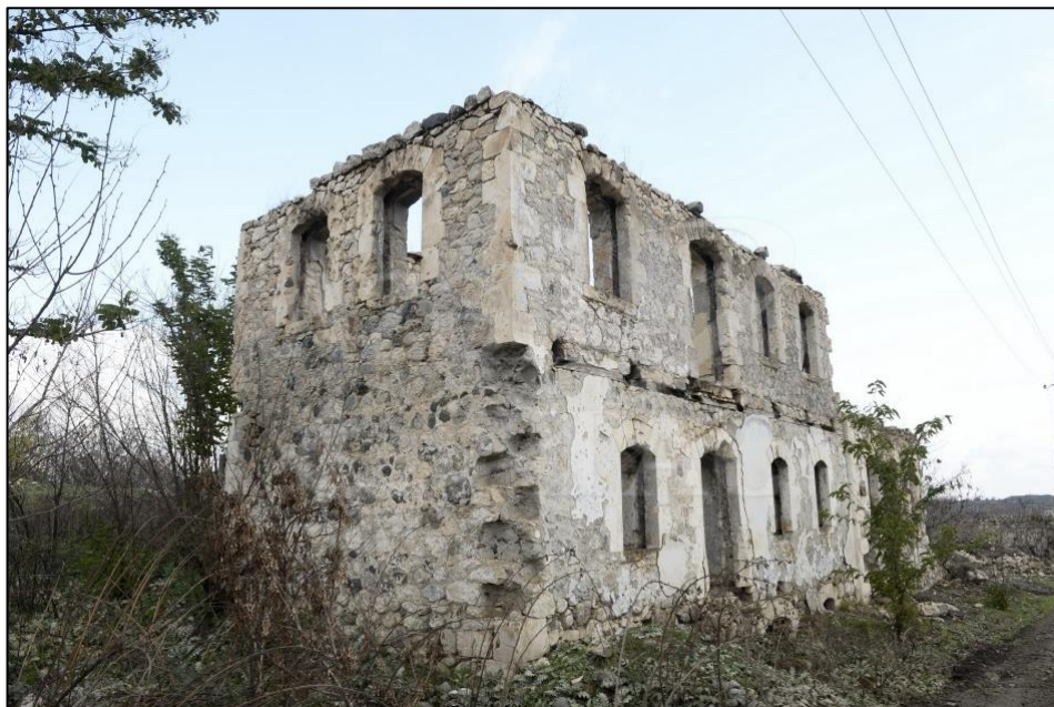
Füzuli şəhərində erməni vandalları tərəfindən dağıdılmış memarlıq binası