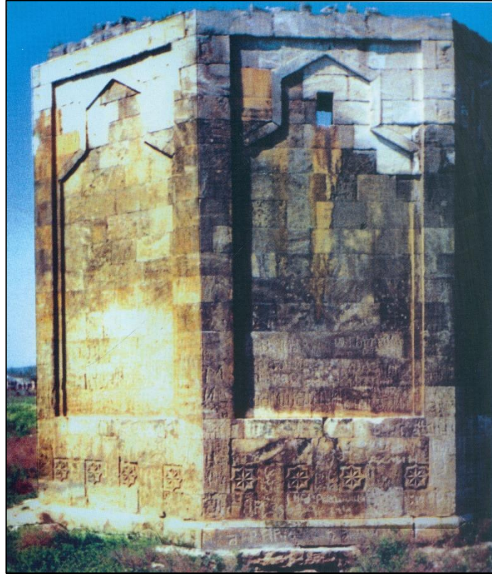
Babı kəndindəki XIII əsrə aid türbə.