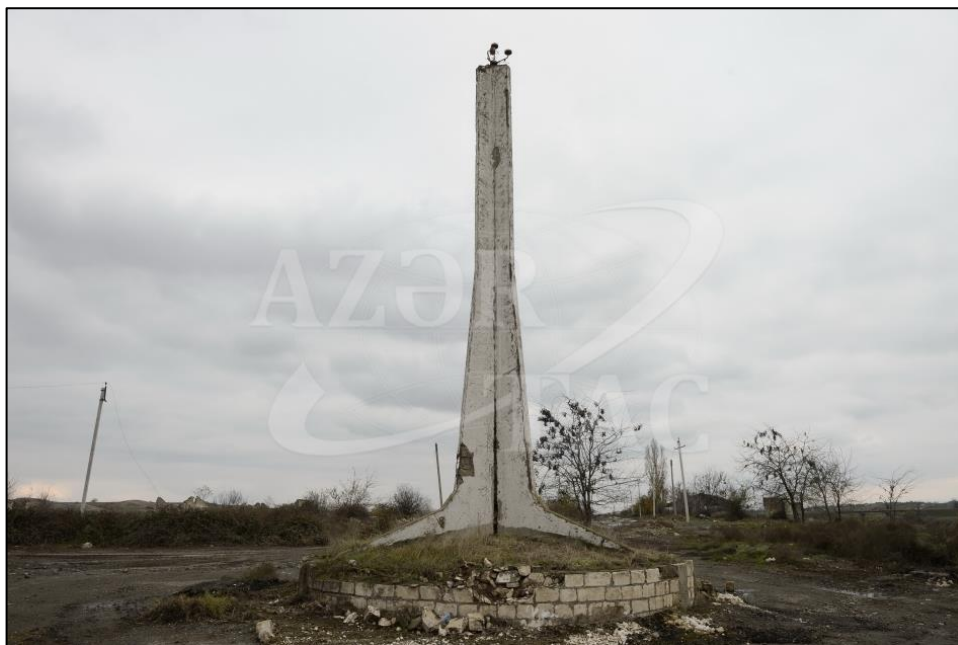
Füzuli rayonu ərazisində erməni vandalları tərəfindən dağıdılmış memarlıq abidəsi