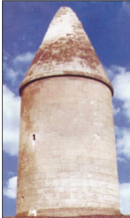
Aşağı Veysəlli kəndindəki XIV əsrə aid Mir Əli türbəsi