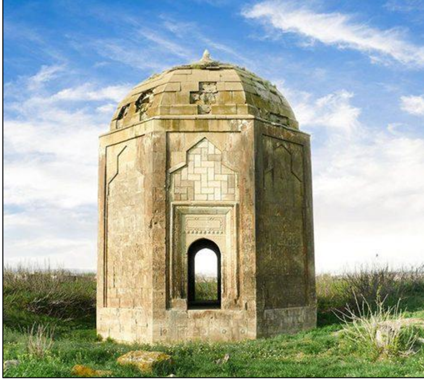
Əhmədəlilər kəndindəki XIII əsrə aid Arğalı türbəsi.