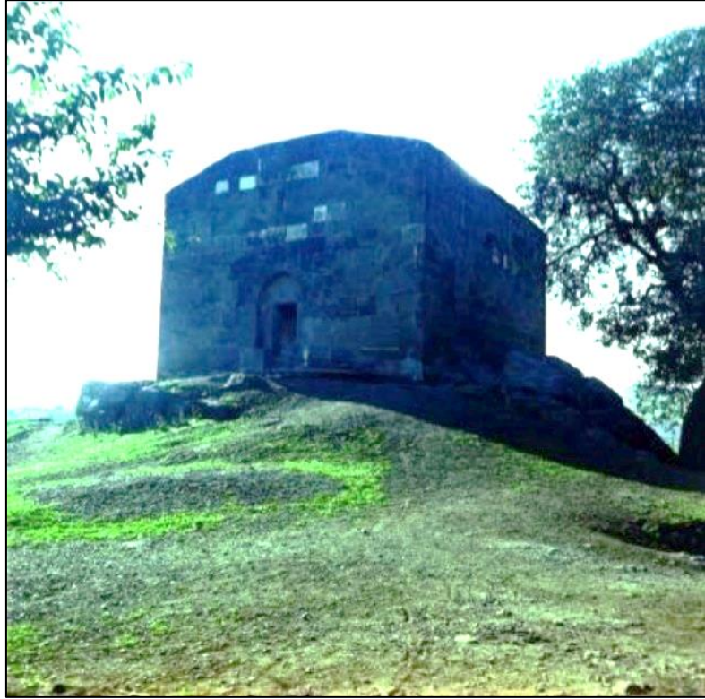
Qarğabazar kəndində məscid. Erməni vandalları tərəfindən dağıdılmışdır.