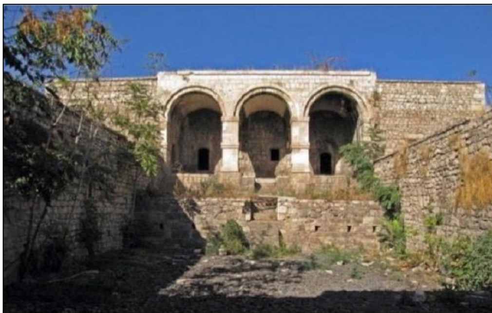
Qarğabazar kəndində karvansara. Erməni vandalları işğal illərində tövlə kimi istifadə etmişlər.