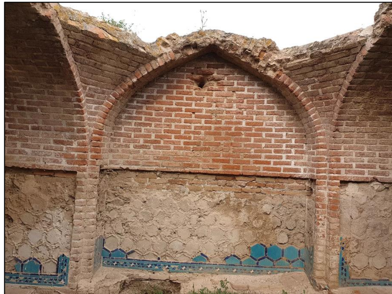
Babı kəndinin ərazisində qədim şəhərin qalıqları