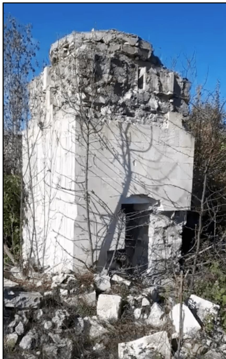
Qaraxanbəyli kəndində erməni vandalları tərəfindən dağıdılmış məscid