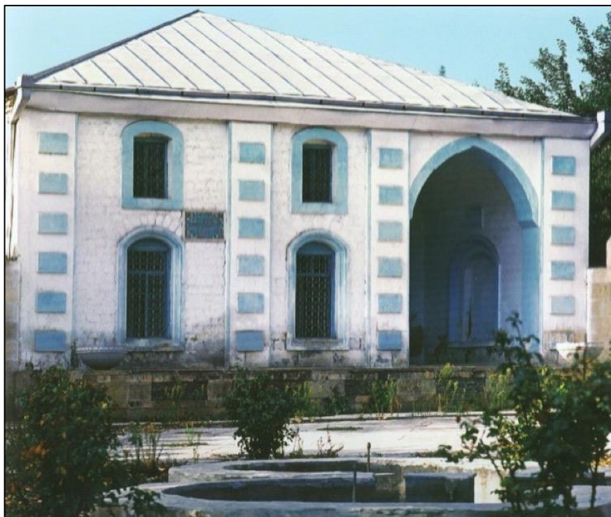
Füzuli şəhərindəki Hacı Ələkbər məscidi. Erməni vandalları tərəfindən dağıdılmışdır.