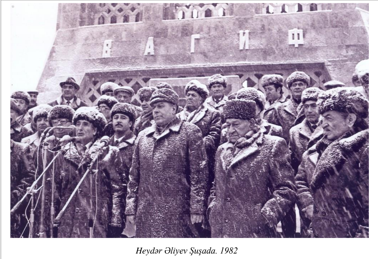
Heydər Əliyev Şuşada. 1982

1976-1982-ci illərdə Şuşada tikinti-abadlıq işlərinə 20 milyon manat vəsait ayrılışdır ki, bu