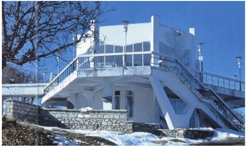
Mineral su qalereyası

Lakin Şuşada başlanmış bu mədəni oyanış uzun çəkmədi. Sovet İttifaqının tənəzzülü zamanı Dağlıq Qarabağda gizli fəaliyyət göstərən silahlı erməni terrorçu dəstələri yenidən fəallaşdılar. M. Qorbaçov tərəfindən müdafiə olunan və Dağlıq Qarabağın separatçılarna hər cür köməklik göstərən Ermənistanın silahlı qüvvələri Azərbaycanın sərhədlərini pozaraq Qarabağın işğalına başladılar. 1992-ci il