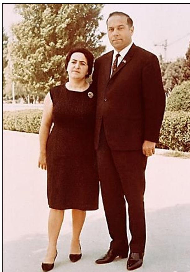
Zərifə xanım və Heydər Əliyev. 1966