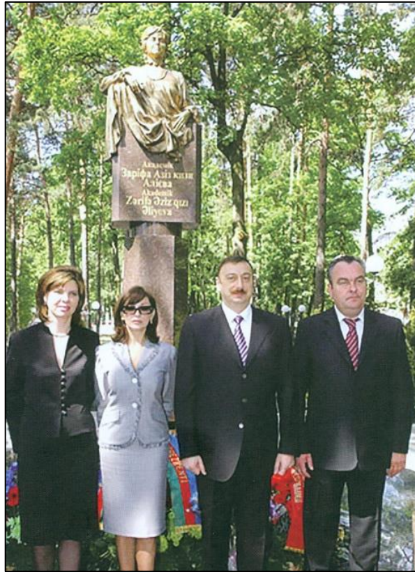
Ukraynanın İrpen şəhərində akademik Zərifə Əliyevanın abidəsinin açılış mərasimi. 04.06.2004