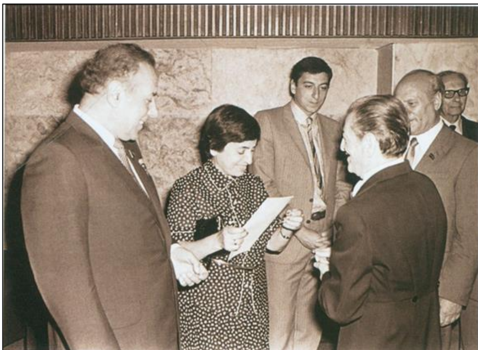
Heydər, Zərifə və İlham Əliyevlər maestro Niyazi ilə. 1983