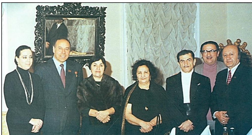
Zərifə və Heydər Əliyevlər Azərbaycan və Rusiya musiqi xadimlərini qəbul edərkən. 1981-ci il.