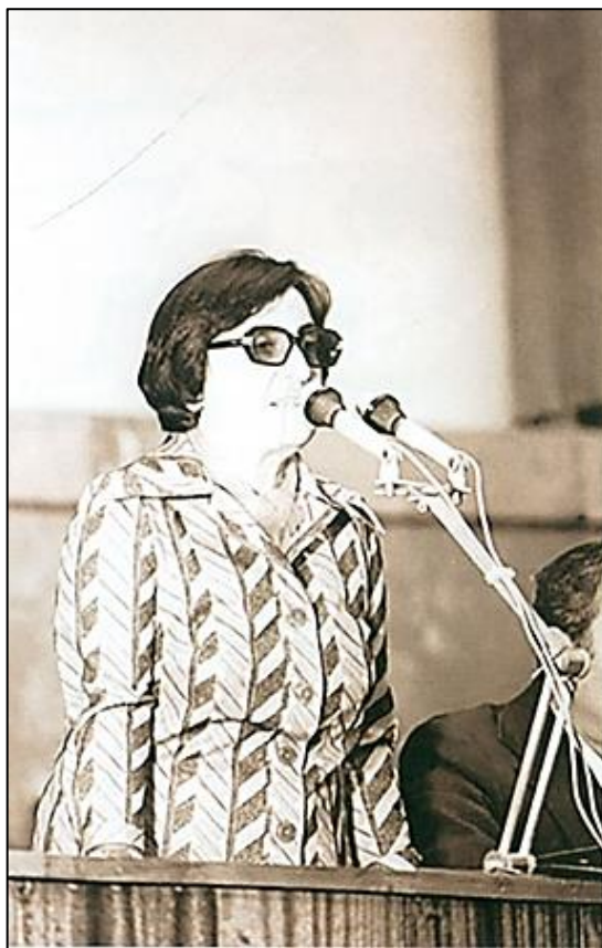
Bakıda keçirilən Ümumittifaq Oftalmoloqlar Cəmiyyətinin plenumunda çıxış edərkən. 18.10.1977