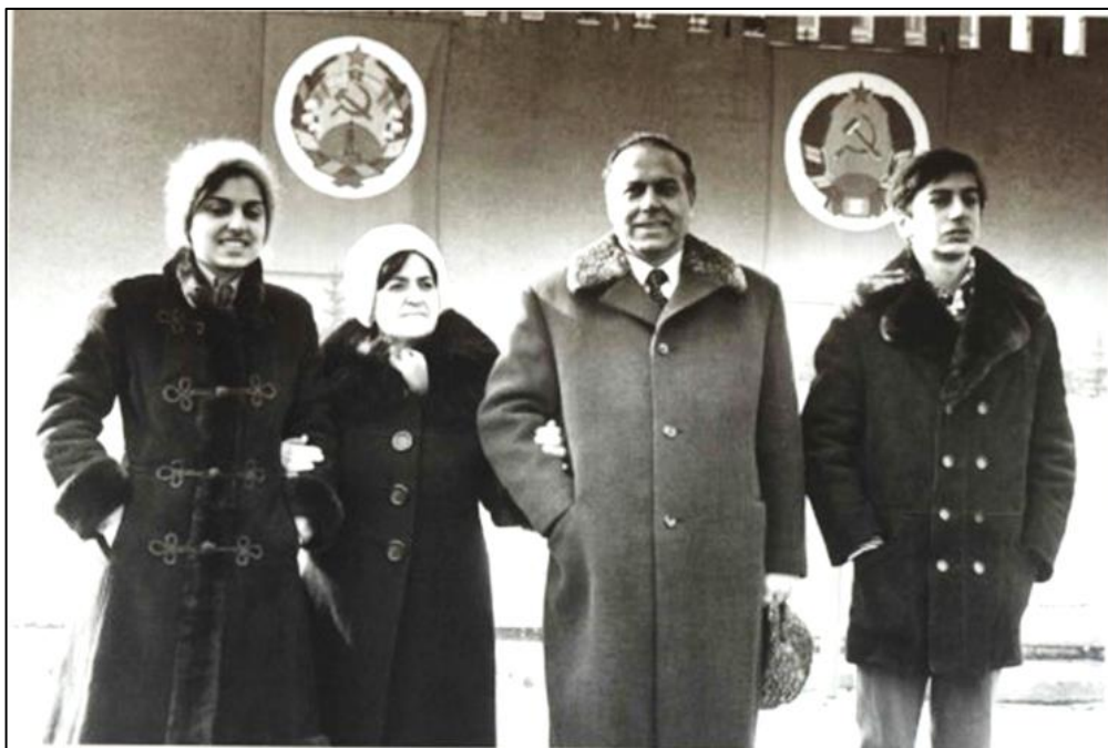
Moskva. Qırmızı meydan. 1976