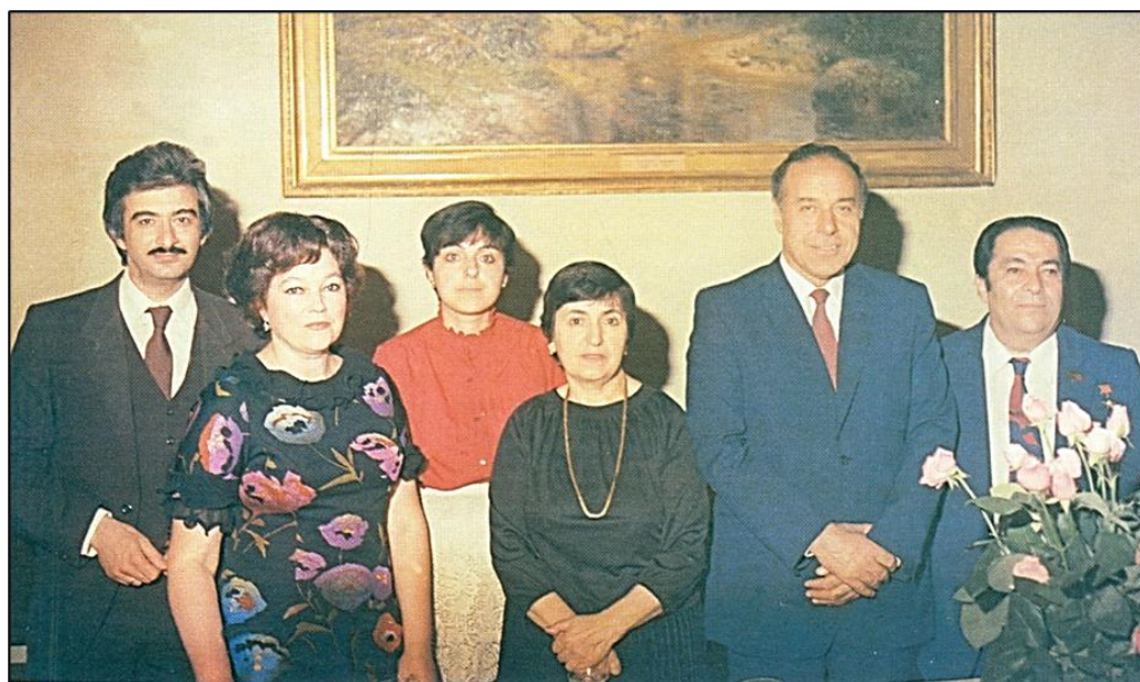
Mədəniyyət xadimləri Əliyevlərin evində qonaq olarkən. 1982-ci il