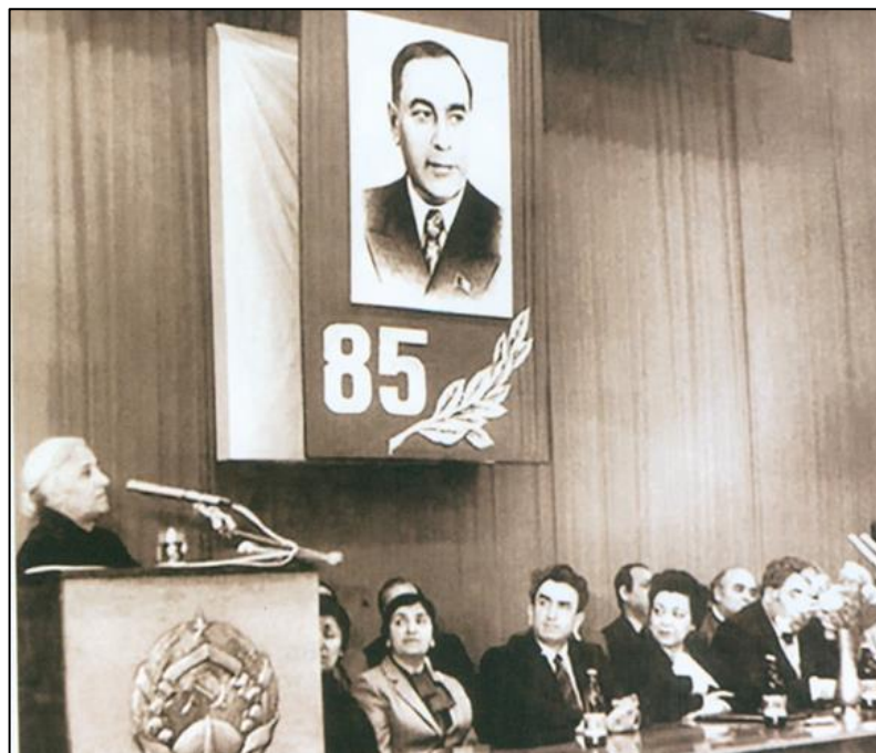
Əziz Əliyevin anadan olmasının 85 illiyinə həsr olunmuş yubiley gecəsi. 1982