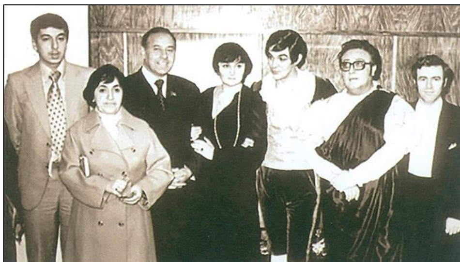
M.F.Axundov adına Opera və Balet Teatrındamədəniyyət xadimləri ilə. 1978