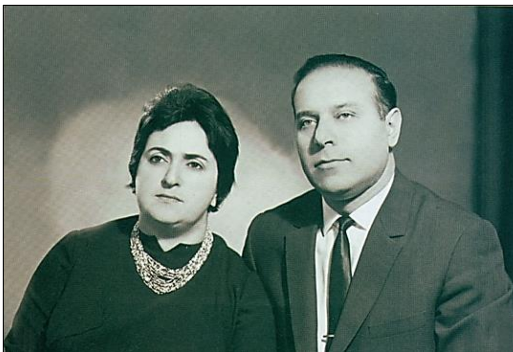
Zərifə xanım və Heydər Əliyev. 1968