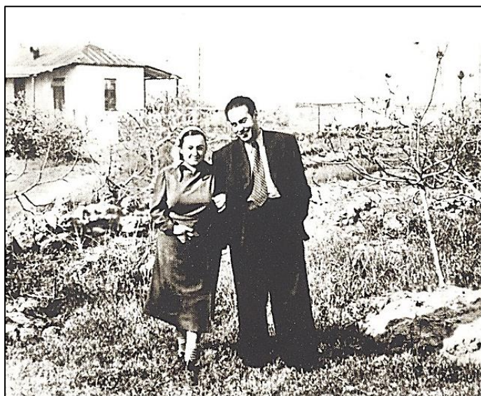
Zərifə xanım və Heydər Əliyev. 1955