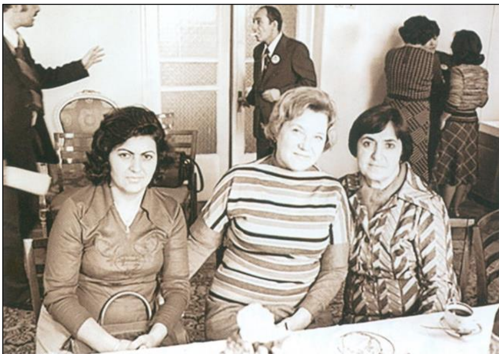
Bakıda keçirilən Ümumittifaq Oftalmoloqlar Cəmiyyətinin plenumunun iştirakçıları ilə birgə. 18.10.1977