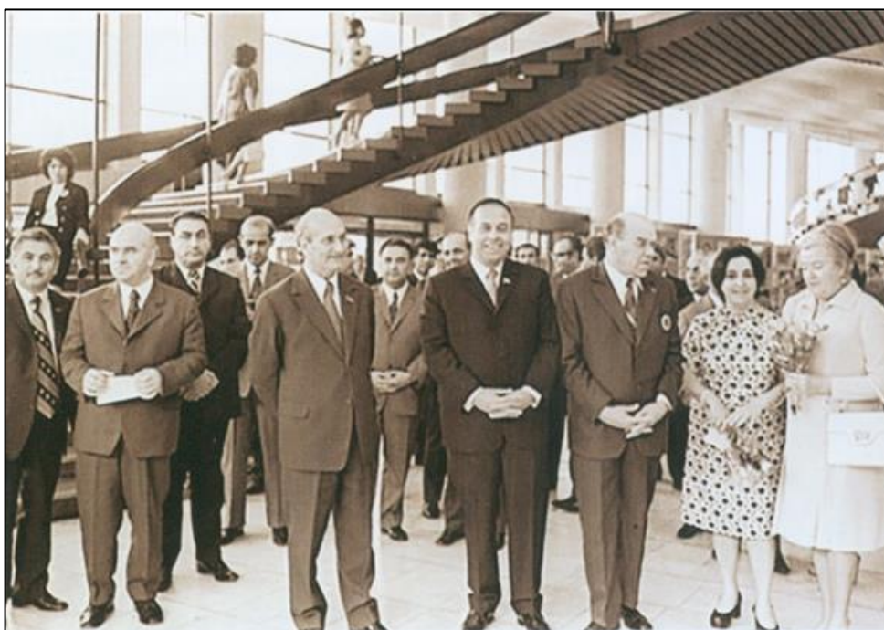
Azərbaycan Dövlət Dram Teatrının 100 illiyinə həsr olunmuş tədbirdə. 31.05.1974