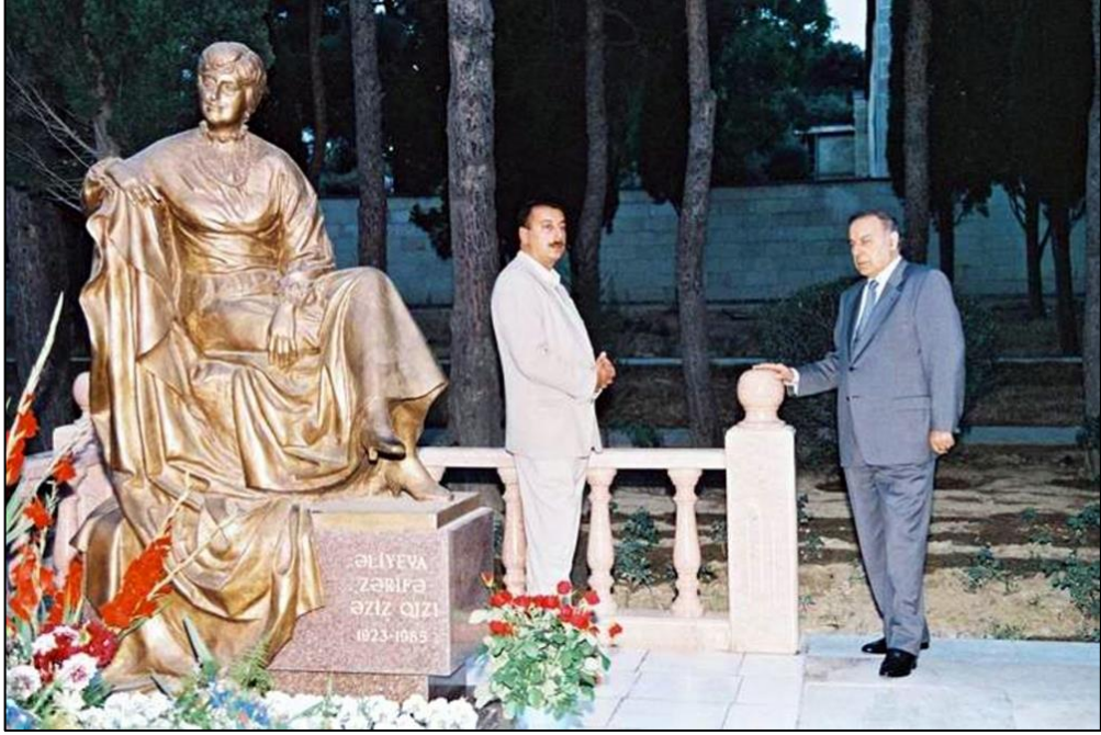
Heydər Əliyev və İlham Əliyev Zərifə Əliyevanın məzarını ziyarət edərkən. 1997