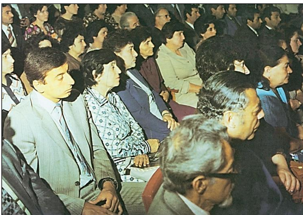
Zərifə xanım Əliyeva oğlu İlham ilə. 1981