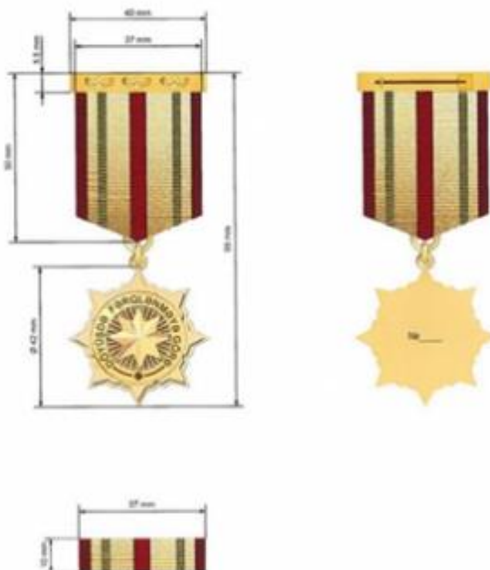
“Döyüşdə fərqlənməyə görə” Azərbaycan Respublikasının medalı

Медаль носится на левой стороне груди, при наличии других орденов и медалей Азербайджанской Республики - после медали «Отважный боец».