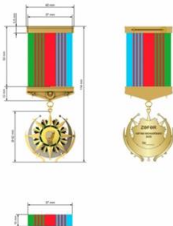
Azərbaycan Respublikasının "Zəfər" ordeni

Орден «Зефер» Азербайджана носится на левой стороне груди, при наличии других орденов и медалей Азербайджанской Республики - после ордена «Гейдар Алиев».