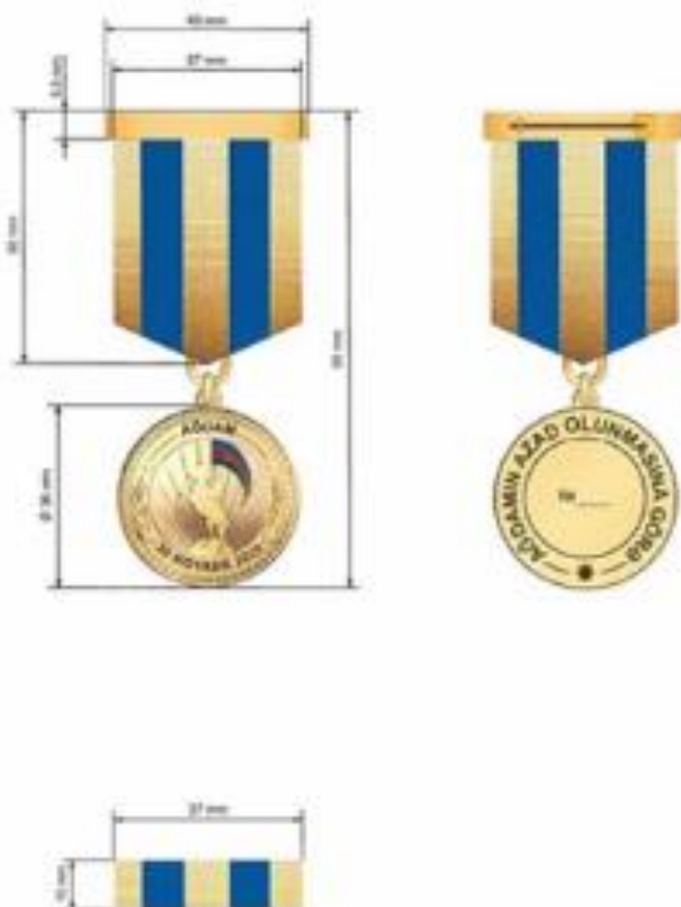
“Ağdamın azad olunmasına görə” Azərbaycan Respublikasının medalı

Медаль Азербайджанской Республики «За освобождение Агдама» носится на левой стороне груди, при наличии других орденов и медалей Азербайджанской Республики - после медали «За освобождение Кельбаджара».