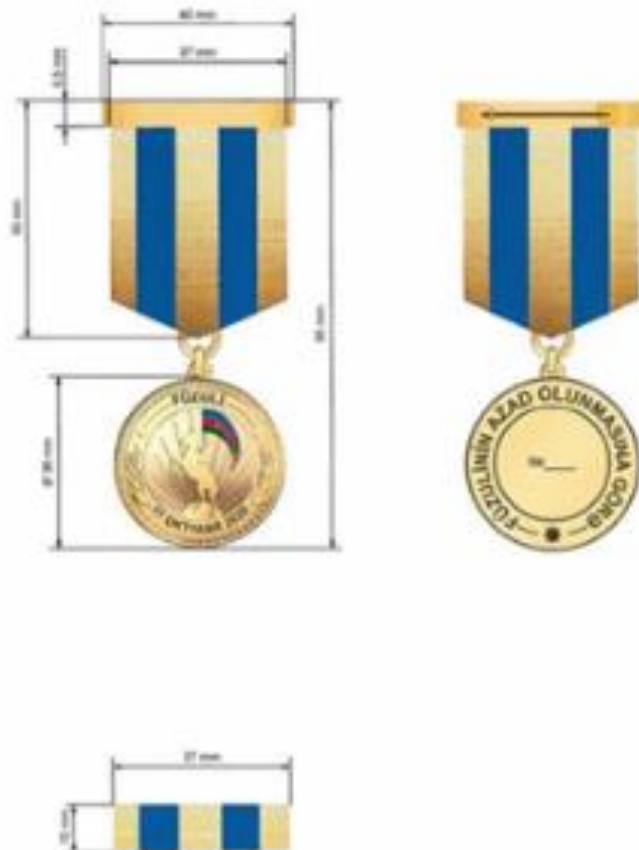
“Füzulinin azad olunmasına görə” Azərbaycan Respublikasının medalı

Медаль Азербайджанской Республики «За освобождение Физули» носится на левой стороне груди, при наличии других орденов и медалей Азербайджанской Республики - после медали «За освобождение Ходжавенда».