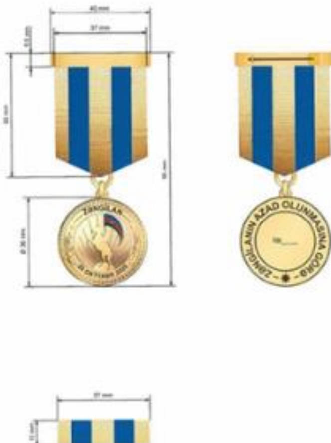
“Zəngilanın azad olunmasına görə” Azərbaycan Respublikasının medalı

Медаль Азербайджанской Республики «За освобождение Зангилана» носится на левой стороне груди, при наличии других орденов и медалей Азербайджанской Республики - после медали «За освобождение Физули».